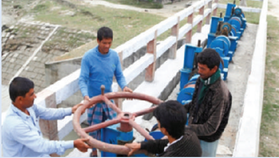
পানি ব্যবস্থাপনা গ্রুপ (WMG) দ্বারা স্লুইস অপারেশন