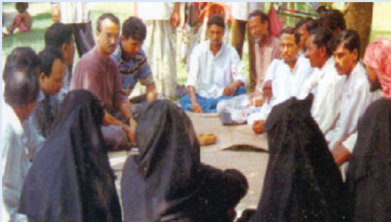
পানি ব্যবস্থাপনা গ্রুপ (WMG) এর সভা