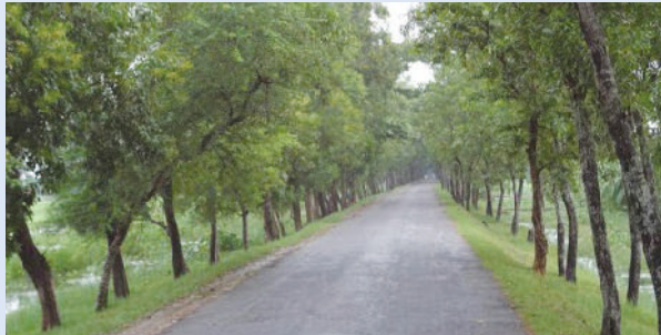
নির্মাণকৃত বাঁধের উপর সড়ক