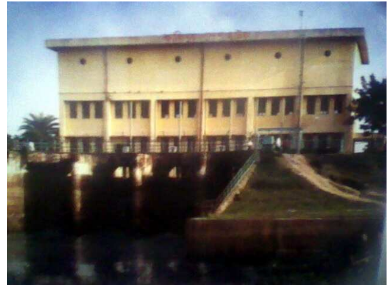
কালিপুর পাম্প হাউস